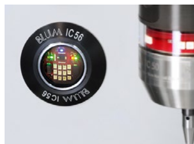
IC56: Montaggio con Front-Kit