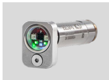
IC57 per il montaggio nella scatola mandrini