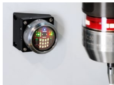
IC56: Montaggio con adattatore angolare